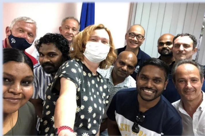
Sudionici UN4DRR treninga, Maldivsko nacionalno sveučilište 9.-11.12.2021