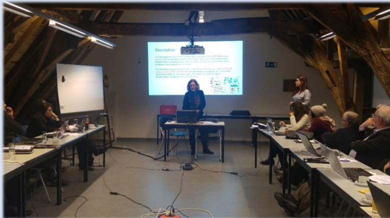
Kick-off konferencija SEED4NA projekta, Leuven, 19.02.2020.