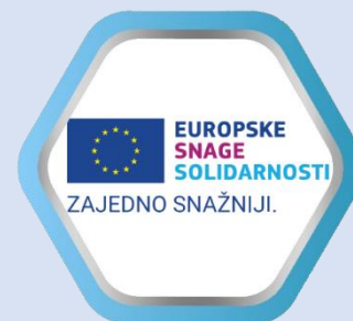
Europske snage solidarnosti