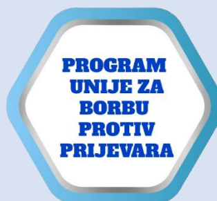
Program Unije za borbu protiv prijevara